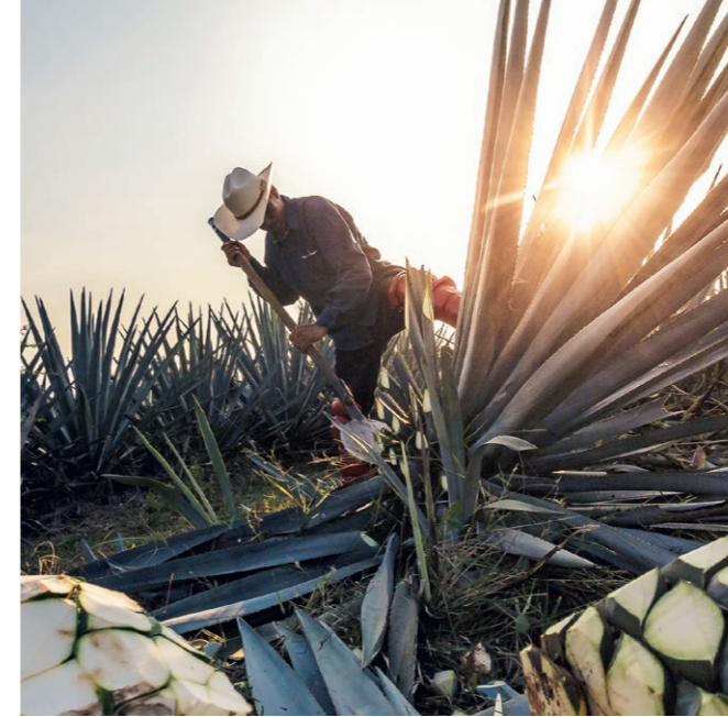
Agavendicksaft und Honig aus Mexiko

Unsere Standorte in Ungarn, Mexiko, Argentinien, China und Singapur stellen ein globales Beratungs- und Service-Team direkt vor Ort sicher.