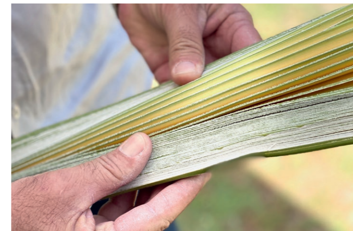
Wachse aus Brasilien

Ob Süßwaren, Kosmetik- oder pharmazeutische Artikel, unsere Produkte machen Endprodukte besser.